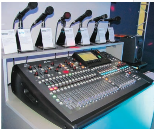
Микшерный пульт Behringer X32

Компания I.S.P.A.-Engineering ( www.ispa.ru ) предлагала протестировать радиосистемы MIPRO и оценить звучание микрофонов Audix и DPA. На стенде также была проведена презентация Behringer X32 – 32-канального цифрового микшерного пульта с