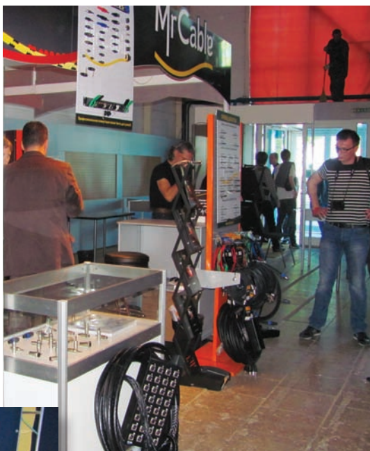
На стенде Mr. Cable

На стенде RODE ( www.rodemic.com ), на выставке ее представляла компания «Окно-ТВ», демонстрировалась практически полная линейка микрофонов RODE, включая модели серии VideoMic для DSLR-камер, а также микрофоны-пушки серии NTG. Среди них была и новинка NTG-8 со значительно увеличенной направленностью во всем диапазоне частот, минимальным уровнем собственного шума, дающая естественный натуральный звук без окраски, как по оси микрофона, так и вне нее. Модель предназначена для кино, телевидения, прямого эфира и любых других приложений, где требуется высокое качество звука на большом расстоянии.