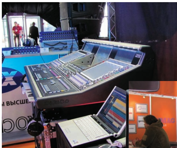
Микшер DiGiCo SD10

DiGiCo SD10, новую V-серию акустических систем d&b audiotechnik, цифровую радиосистему TG 1000 и наушники Custom One Pro фирмы Behringer, акустические системы обновленной серии 4PRO RCF, а также компрессоры ARX. На уличной площадке рядом с павильоном 4.1 прошла «громкая» демонстрация нового активного линейного массива в пластиковом корпусе RCF D-Line.