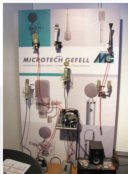
Микрофоны RODE и MicroTech Gefell

цветовых эффектов демонстрировали компании «Светоч-Сэмлайт» ( www.samlight.ru ), Robolight ( www.robolight.ru ) и Global Lighting ( www.light77.com ), а Screen Agency ( www.screenagency.ru ) представила светодиодные экраны-сетки, способные передавать изображение с яркими и насыщенными цветами при любом освещении. Для оснащения масштабных шоу-проектов предлагали свои решения и компании с большим опытом работы в области профессионального аудиовизуального оборудования. Так, компания «СНК-Синтез» рассказывала о возможных вариантах надежной коммутации и преобразования сигналов, а Varco, почти исчерпав потенциал роста за счет переоснащения кинотеатров цифровыми проекторами, убеждала в преимуществах своей мощной световой «артиллерии».